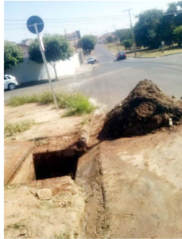
Os serviços de limpeza de galerias começarão em breve

A equipe de Obras da Prefeitura de Fernandópolis vem constantemente realizando trabalhos diários para a recuperação da malha asfáltica da cidade e junto a esse trabalho vem a identificação de pontos de alagamentos causados pelo entupimento de galerias pluviais. O monitoramento aponta que a principal causa dos entupimentos é decorrente de lixo doméstico (principalmente garrafas ‘pet’), e da construção civil, que acaba