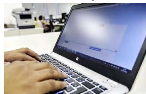
Informação é de pesquisa da ICTS Protiviti, que aponta ainda que mais de 70% delas não têm controle sobre os dados que possui

Já os clientes poderão entrar em contato com qualquer empresa ou órgão público e perguntar que dados detêm, que uso fazem e quem