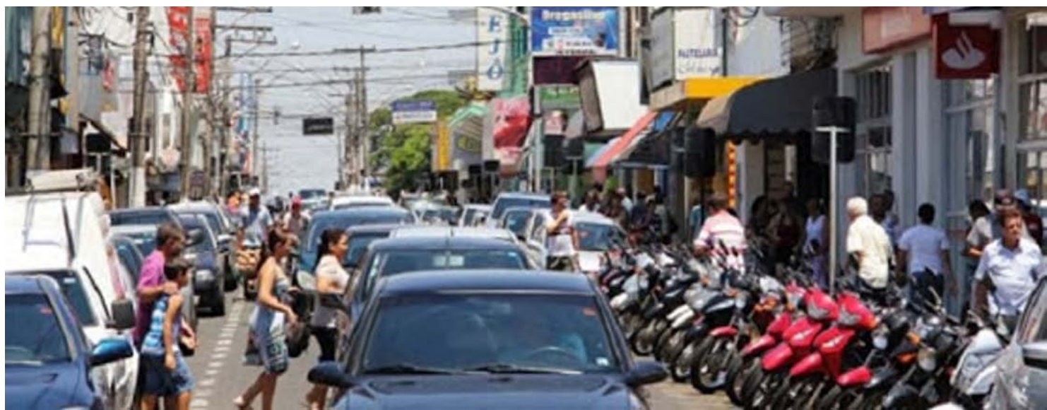
Pesquisa ouviu mais de 2.100 consumidores, com e sem restrição, durante o 2º semestre de 2019

De acordo com a pesquisa Perfil do Consumidor, realizada pela Boa Vista, 55% dos consumidores, com o nome sujo ou não, deixariam de pagar primeiro os financiamentos, que são contas pagas com boletos e carnês, e despesas diversas em caso de diminuição da renda familiar. Em seguida, 34% deixariam de pagar o cartão de crédito, enquanto 11% atrasariam o pagamento de empréstimo e cheque especial. A pesquisa ouviu pouco mais de 2.100 consumidores em todo o Brasil durante o 2º semestre de 2019.