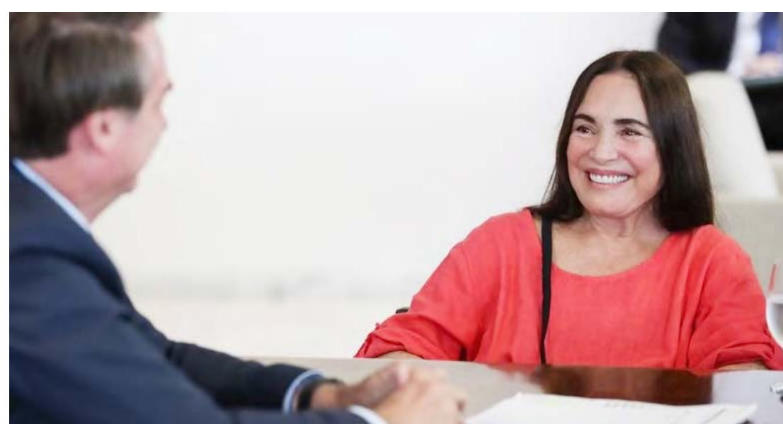
Apesar da sinalização positiva da atriz, a data para oficializar ainda não foi divulgada e a nomeação depende de publicação no Diário Oficial da União

Regina terá pela frente a missão de atuar na formulação de políticas, programas, projetos e ações que promovam a cidadania por meio da cultura. O setor audiovisual e a Agência Nacional do Cinema (Ancine) estão sob o guarda-chuva da secretaria, assim como o Programa Nacional de Cultura, o Programa de Incentivo à Leitura, o Programa de Cultura do Trabalhador e o