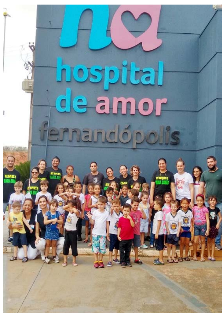
Material recolhido foi destinado como doação para o Hospital do Câncer de Fernandópolis

A EMEI Maria Simão entregou nesta semana 150 mil tampinhas de plástico ao Hospital do Câncer de Fernandópolis, na celebração de uma campanha que durou três meses e contou com a participação de pais, alunos e toda a sociedade motivada em fazer o bem.