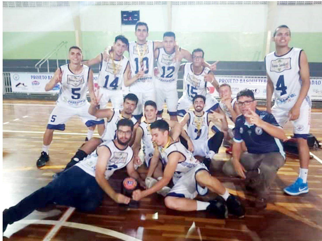
Time da APAB acumulou uma série de vitórias ao longo do ano

“Ao longo da competição os meninos assimilaram bem a proposta de trabalho, entenderam nossa filosofia de jogo dando à equipe um padrão de competição definido, o que garantiu o