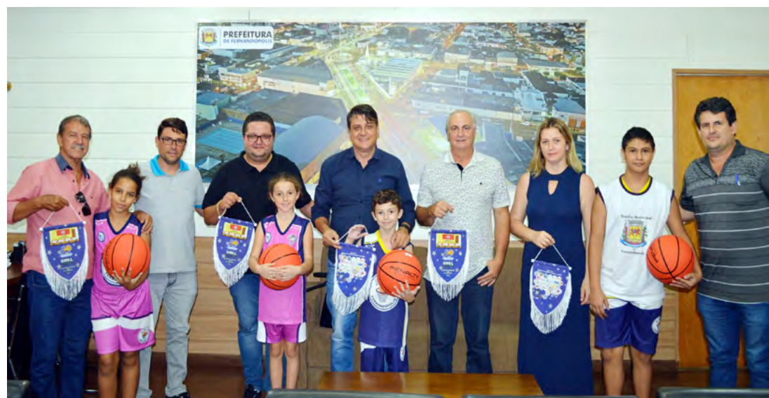
Atividade esportiva é oferecida a alunos do terceiro ao quinto ano do ensino fundamental