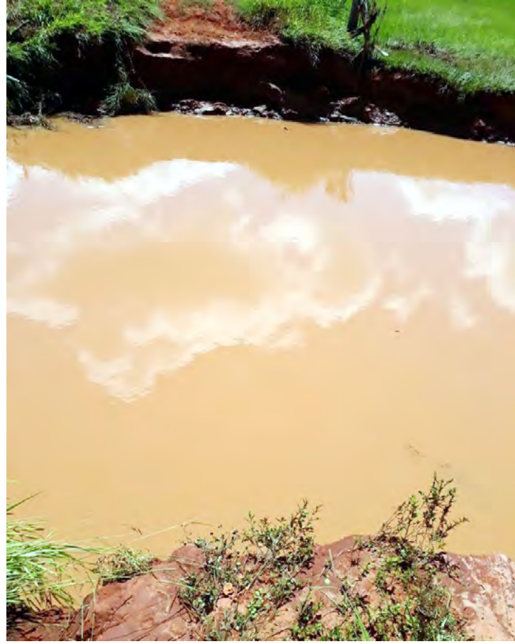
Local onde existia a ponte sobre o Córrego da Ilha