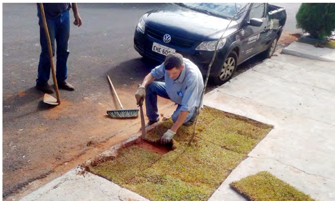
Serão plantadas mudas adequadas para calçadas no entorno do CEMEI Albertina Roza de Souza Garcia

A Secretaria Municipal de Meio Ambiente de Fernandópolis iniciou a implantação do projeto piloto "Floresta Urbana" no CEMEI Albertina Roza de Souza Garcia, no Parque das Nações. O bairro será beneficiado com a criação de