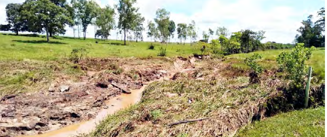
Leito do Córrego

devido a situação das estradas. Outros estão com problemas em açudes, na medida do possível estamos atendendo a todos, mas foi muita chuva”, informou um funcionário da prefeitura de Pedranópolis.