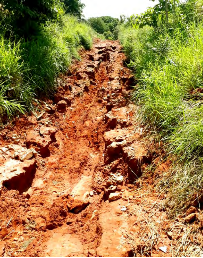
Estrada do Córrego da Ilha