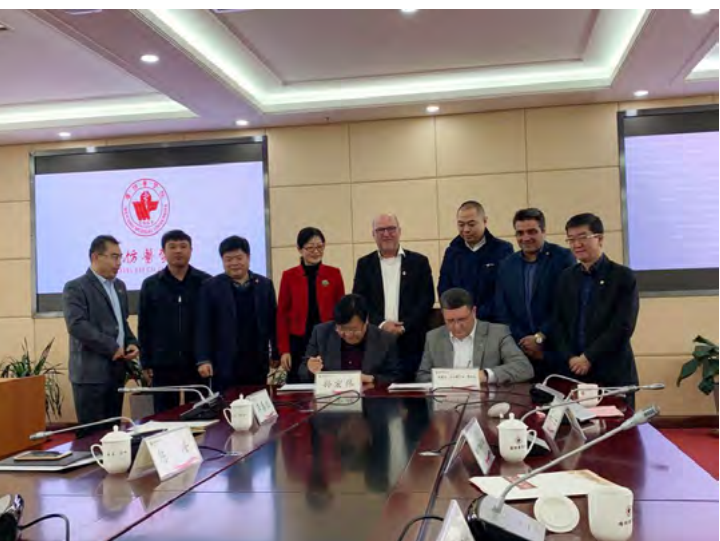
Durante visita, representantes da Universidade fecharam parcerias com duas instituições chinesas nas áreas de Medicina, Odontologia e Medicina Veterinária

A Universidade Brasil está mostrando que a busca pelo conhecimento não tem fronteiras. Representantes da universidade estiveram em visita à China, onde puderam fechar convênios de cooperação com duas importantes instituições de ensino chinesas, que permitirão o intercâmbio de alunos e professores com aqueles países.