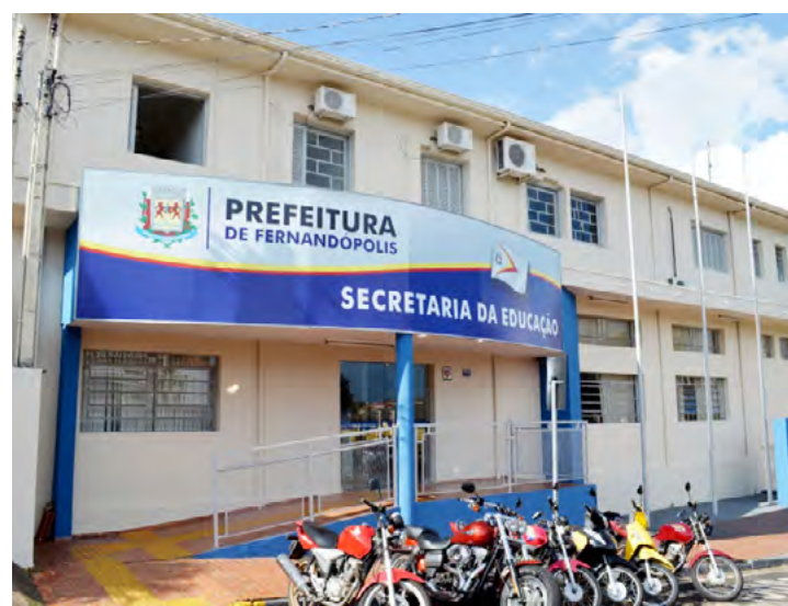
Inscrições para processo seletivo de estagiários vão até o dia 29

Interessados devem procurar a Secretaria Municipal de Educação das 8h às 13h