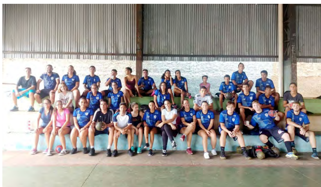
Modalidade esportiva cresce em Fernandópolis e ganha dezenas de adeptos