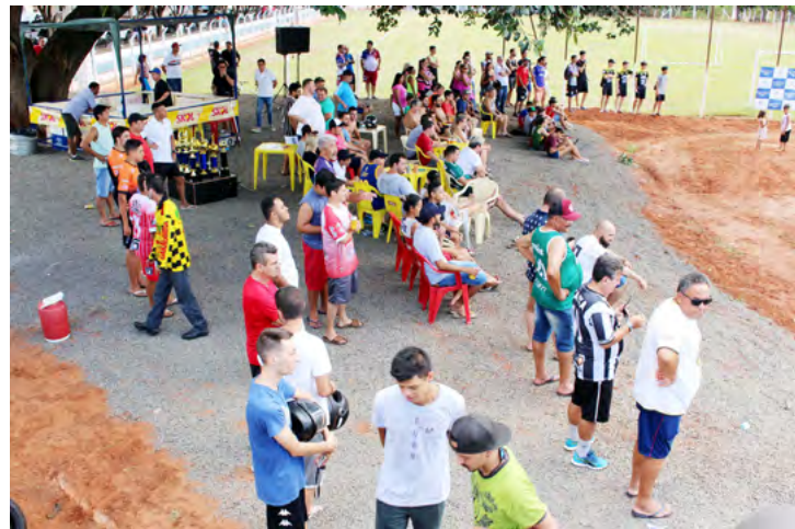
O público compareceu para assistir aos múltiplos jogos do campeonato e aprovou o que viu por lá

“Fiquei muito satisfeito e feliz em ver toda essa bonita estrutura montada na área do Campo da FEPASA e principalmente o número de participantes inscritos e o público presente, mostrando que a iniciativa foi aprovada e prestigiada. O objetivo é esse, de oferecer lazer e entretenimento à população, e promover isso por meio do esporte, é uma grande alegria e nos motiva cada vez