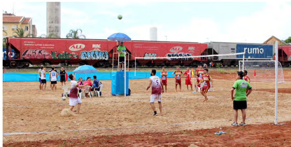
O 1º Festival Esportivo de Verão teve início com vários jogos acirrados disputados nas modalidades de futebol de areia, futevôlei (foto), vôlei em dupla e vôlei adaptado