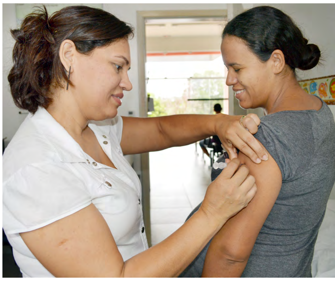
Existem doses para atualização da caderneta em todas as fases da vida

indivíduo, devendo ser guardado junto aos demais documentos pessoais. CALENDÁRIO VACINAL DE ADULTOS (20 A 59 ANOS) ● Febre Amarela (dose única, se nunca tiver vacinado) ● Hepatite B (três doses, dependendo da situação vacinal) ● Dupla Adulto (reforço a cada 10 anos) ● Tríplex Viral (duas doses até os 29 anos e uma dose aos que nasceram a partir de 1960). CALENDÁRIO VACINAL DE IDOSOS (60 ANOS OU MAIS) ● Febre Amarela (dose única, se nunca tiver vacinado). Só deve ser tomada após avaliação e autorização de profissional de saúde. ● Hepatite B (três doses, dependendo da situação vacinal) ● Dupla Adulto (reforço a cada 10 anos) ● Pneumocócica 23 Valente (indicada para públicos-alvo específicos dependendo da condição clínica).