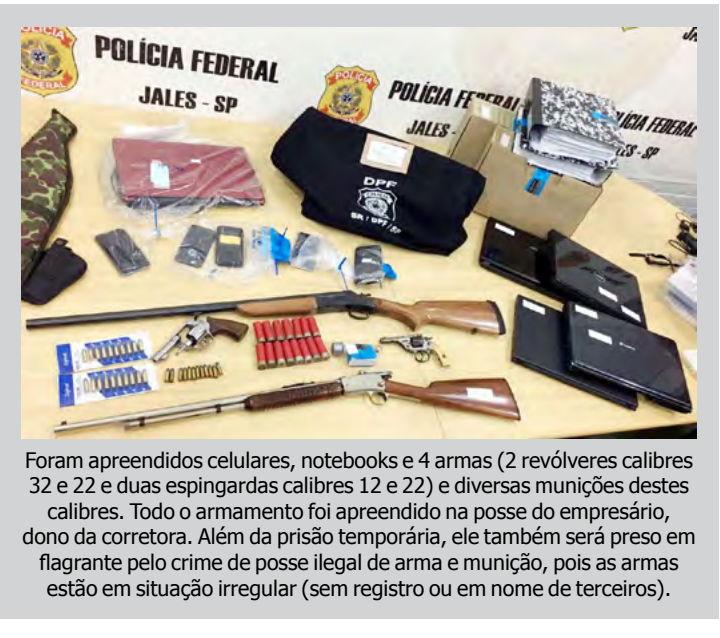
Foram apreendidos celulares, notebooks e 4 armas (2 revólveres calibres 32 e 22 e duas espingardas calibres 12 e 22) e diversas munições destes calibres. Todo o armamento foi apreendido na posse do empresário, dono da corretora. Além da prisão temporária, ele também será preso em flagrante pelo crime de posse ilegal de arma e munição, pois as armas estão em situação irregular (sem registro ou em nome de terceiros).

Os principais crimes investigados são organização criminosa, peculato, estelionato e fraude à licitação. Os presos serão ouvidos pela autoridade policial na sede da PF em Jales e encaminhados para cadeia pública da região onde permanecerão à disposição da Justiça Estadual de Jales.