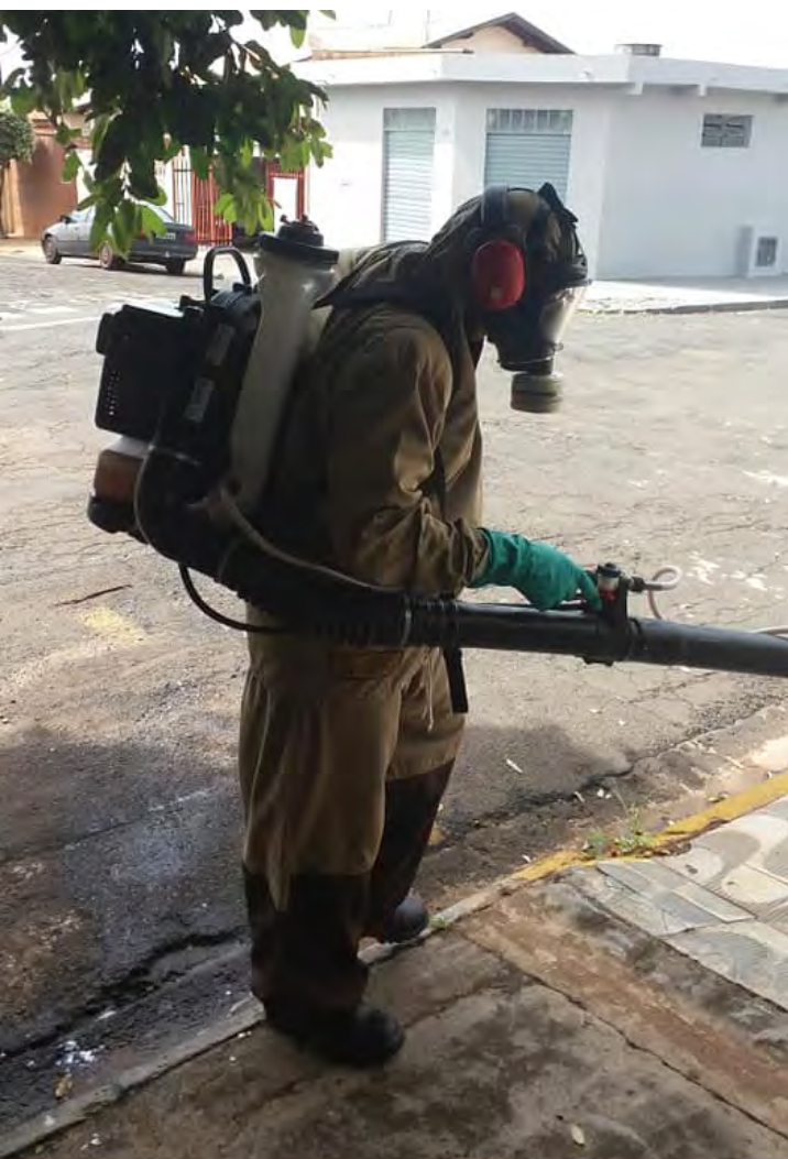
Com a confirmação de 210 casos em 2019, município está em epidemia

Iniciou nesta semana a parceria do setor de Vigilância em Saúde da Prefeitura de Fernandópolis com a SUCEN (Superintendência de Controle de Endemias do Estado de São Paulo) para as ações de combate à dengue. A novidade foi anunciada na tarde desta quinta-feira, 14, na primeira reunião do ano do Comitê de Combate à Dengue.