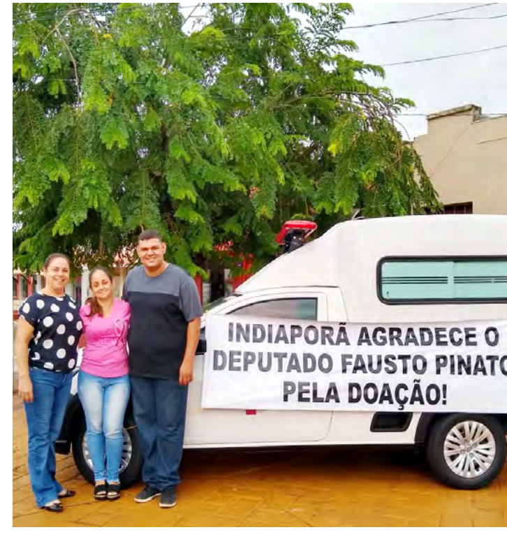
INDIAPORÃ AGRADECE O DEPUTADO FAUSTO PINATO PELA DOAÇÃO!