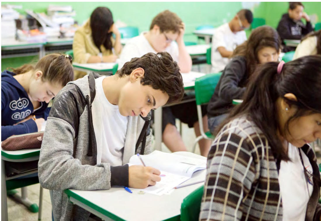
Avaliação feita em 2018 mostra avanços na educação