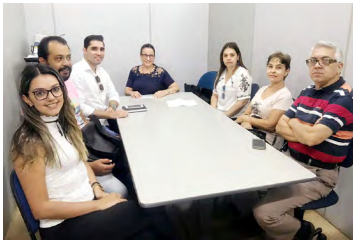
Com atuação do curso de Direito da Universidade Brasil, em parceria com o TJ-SP e com a OAB, cerca de 12 mil pessoas passaram pelo NPJ

O Núcleo de Prática Jurídica da Universidade Brasil Campus Fernandópolis realizou, em 2018, 2.596 atendimentos ao público no setor do Cartório Anexo do Juizado Especial Cível. Desse total, foram confeccionadas e distribuídas 543 ações pelos estagiários, com a análise e auxílio dos colaboradores e professores do curso de Direito. Entre as ações propostas, destacaram-se as de cobrança, execução de títulos extrajudiciais, aluguéis e, principalmente, as de direito do consumidor, como ações de telefonia, compras realizadas pela internet e bancárias. Além dos atendimentos e proposituras de ações, também foram realizadas 2.326 audiências de conciliação. Somando todos os atendimentos, durante todo o ano passado, passaram pelo Núcleo de Prática Jurídica da Universidade Brasil cerca de 12.000 pessoas.