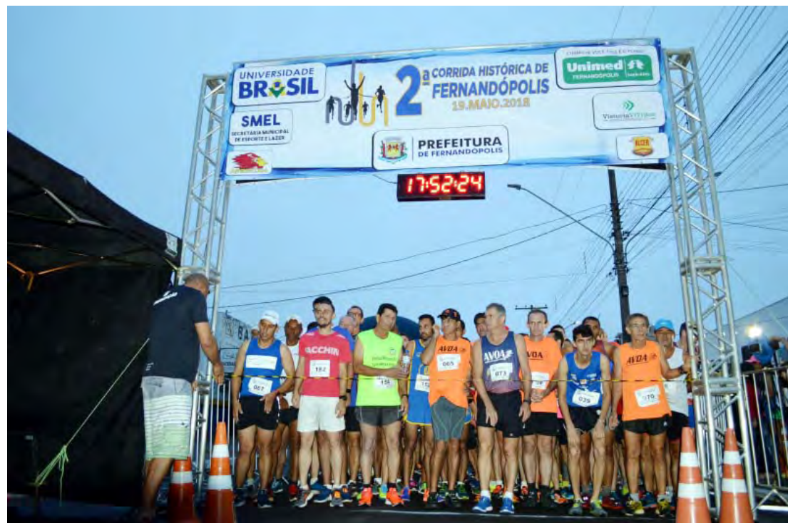
Competição esportiva acontecerá no dia 18 de maio, dentro de calendário de comemorações dos 80 anos de Fernandópolis

Além dos muitos benefícios da prática esportiva, a ‘Corrida Histórica’ busca agregar em Fernandópolis o lado histórico da cidade, utilizando a Av. Líbero de Almeida Silvas que representa a união das Vilas Pereira e Brasilândia.