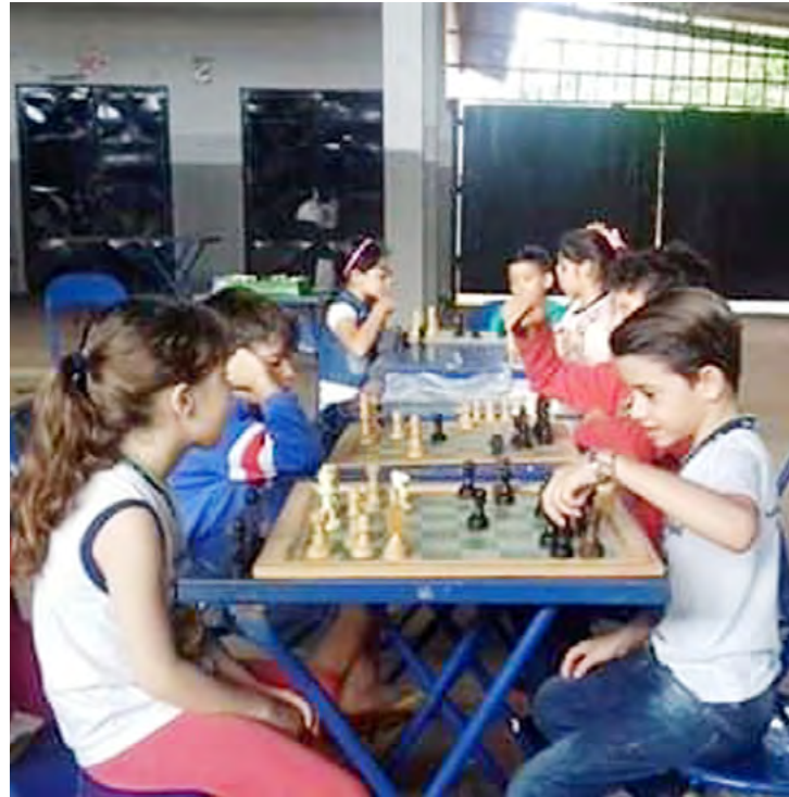
Todos os alunos escola se envolveram na competição