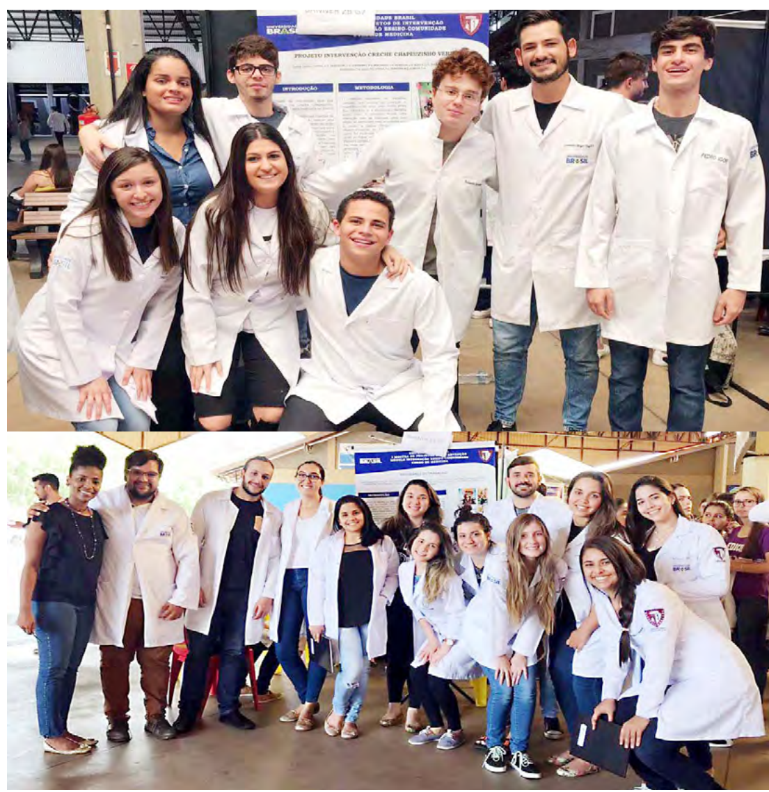
Os alunos do segundo semestre expuseram 32 projetos realizados junto a entidades de Fernandópolis

Cerca de 450 alunos de Medicina participaram dos projetos, uma forma não apenas de incrementar o conhecimento adquirido nas aulas, mas também de se inserir nas demandas sociais da comunidade.