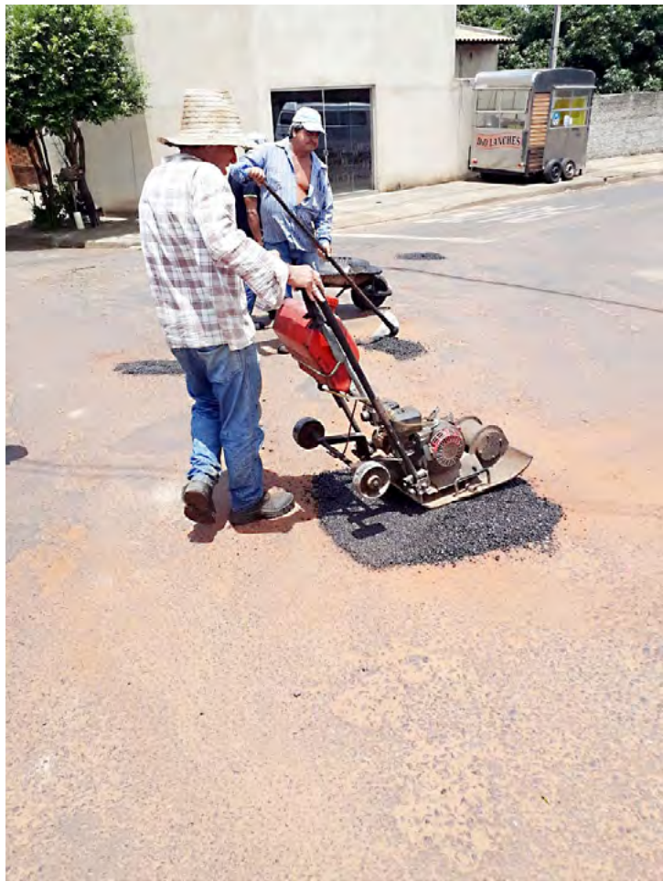
Equipes aproveitaram a semana sem chuva para intensificar ações pelos bairros

A Prefeitura de Fernandópolis através da Secretaria Municipal de Obras intensificou e está realizando uma grande operação de Tapa-Buracos em vários bairros do município. De acordo com