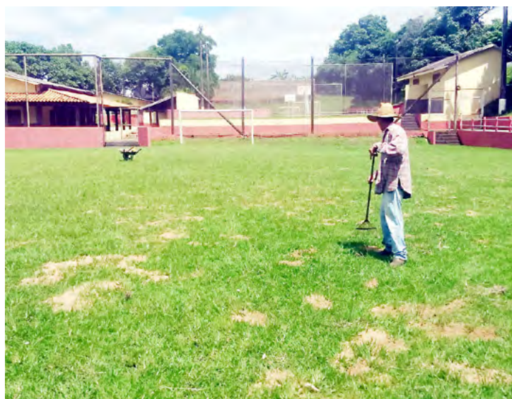
Equipes aproveitam o período chuvoso para fazer reforma no gramado