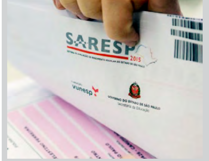
Sistema de avaliação é utilizado para orientar ações de Educação no Estado

Nesta terça, dia 27, e quarta 28, os alunos dos 3º anos e 5º anos das escolas municipais de ensino fundamental de Fernandópolis participam do Sistema de Avaliação de Rendimento Escolar do Estado de São Paulo (Saresp).