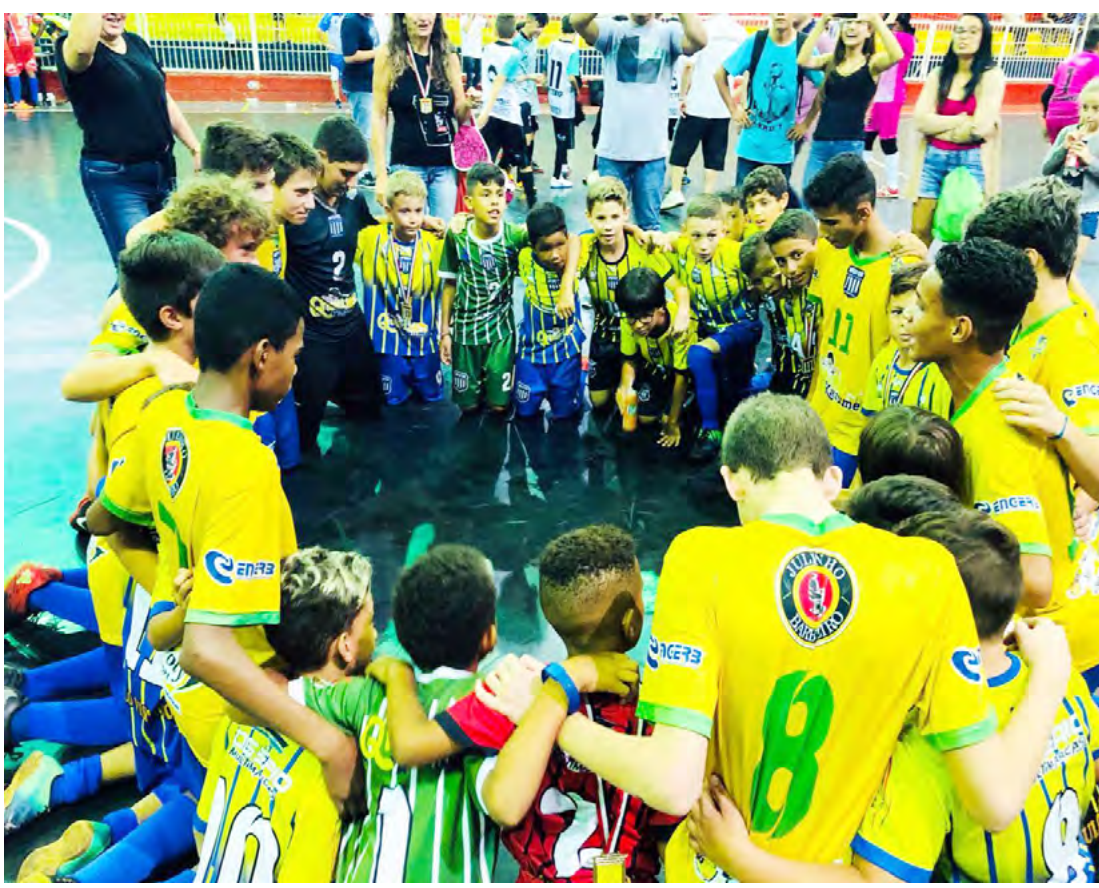
Comemoração dos atletas de futsal de Fernandópolis: Atletas foram destaque na competição que contou com mais de 60 equipes

“Estamos muito felizes com a conquista, pois todos nossos alunos são do projeto ‘Bom de Escola Bom de Esporte’ e eles levaram o nome da nossa cidade a nível estadual, com três equipes