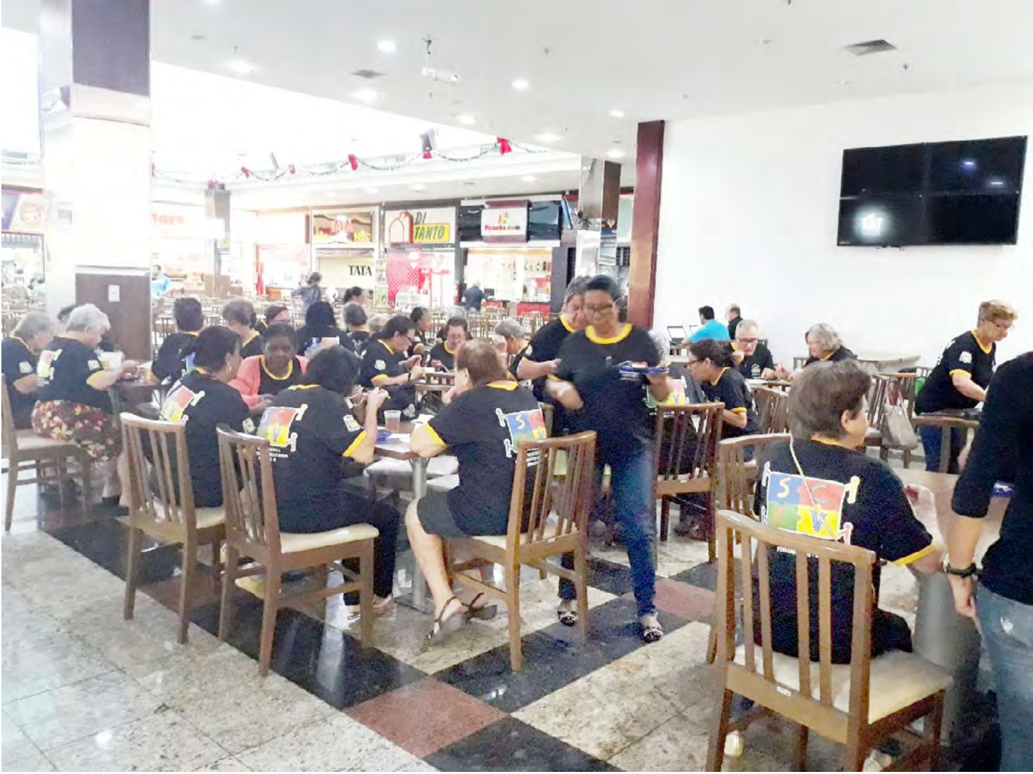
Como presente de natal, eles puderam ainda almoçar no local, afim de confraternizar os grupos e comemorar o Dia do Idoso

Os grupos do SCFV (Serviço de Convivência e Fortalecimento de Vínculos) para Pessoas Idosas do CRAS 'Vida Nova' se encantaram com a magia do Natal ao visitarem o Shopping Center Fernandópolis.