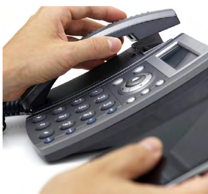
Com possibilidade de realizar chamadas a partir de telefone celular desde setembro, consultas ao Call Center devem aumentar em 2019

Levando em consideração a demanda reprimida, já que até setembro o Call Center não recebia ligações de celulares, a expectativa da Fazenda é que o número de atendimentos cresça cerca de 30%. A novidade permitirá, entre outros fatores, uma atendimento mais rápido e assertivo aos cidadãos no mês de janeiro, quando o número de consultas em reação ao IPVA atinge o pico de demanda – em 2018 foram quase 140 mil ligações. Serviço - Central de Atendimento Telefônico da Secretaria da Fazenda 0800-170 110 (exclusivo para telefone fixo) / (11) 2450-6810 (exclusivo para telefone móvel)