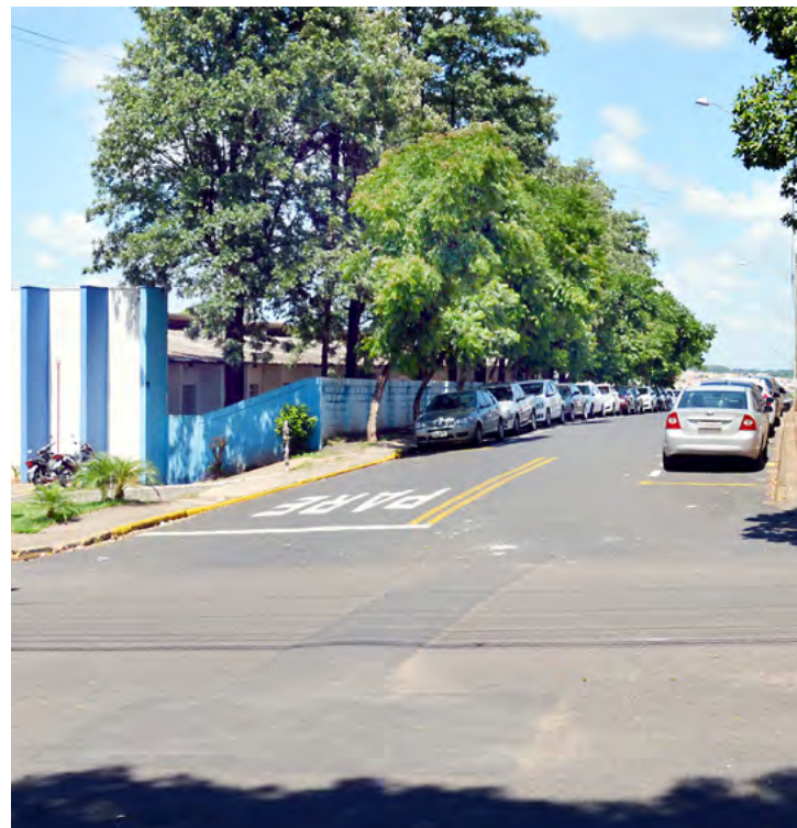
Via será mão única sentido Avenida