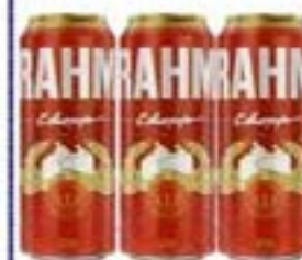
BRAHMA LT 550ml