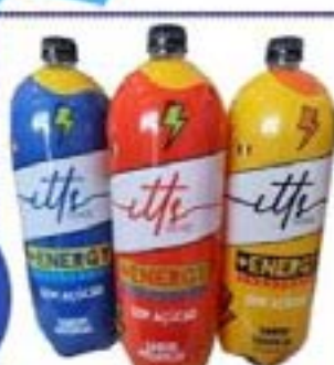
ENERGÉTICO ITTS 2L ZERO AÇUCAR