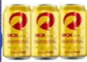
SKOL LT 350ml