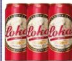
LOKAL LATÃO 473ml