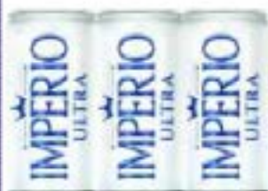
IMPÉRIO ULTRA LT 269ml