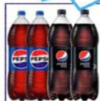
PEPSI ORIG/BLACK 2L