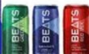
SKOL BEATS LT SABORES