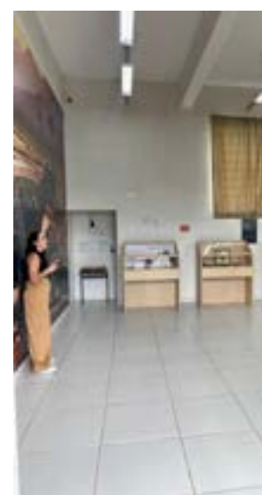
O Museu de Paleontologia será uma das atrações