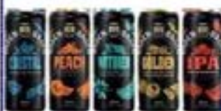
BADEN LT 350ml