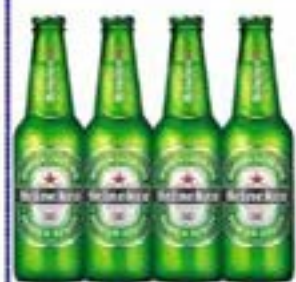
HEINEKEN Long 330ml