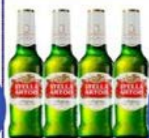
STELLA ARTOIS Long 330ml