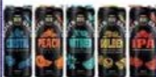
BADEN LT 350ml