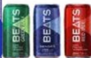
SKOL BEATS LT SABORES