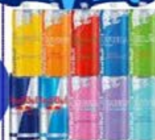
RED BULL SABORES 250ml