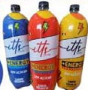
ENERGÉTICO ITTS 2L ZERO AÇUCAR