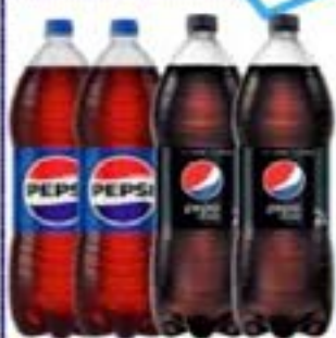
PEPSI ORIG/BLACK 2L