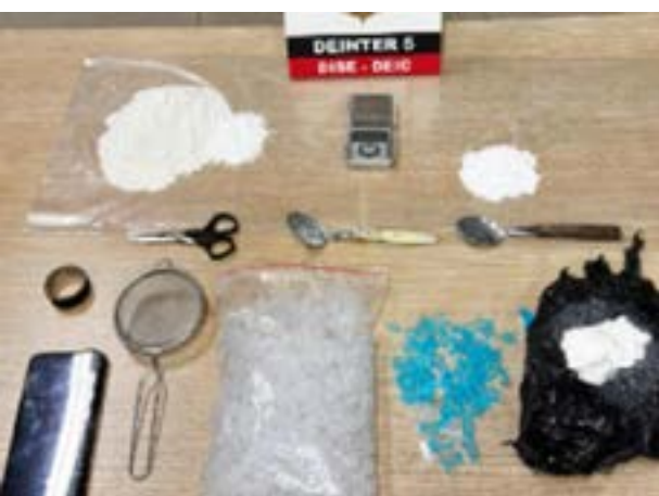
A Delegacia de Investigações Sobre Entorpecentes (Dise), unidade vinculada à Deic do Deinter-5, em Rio

Preto, prendeu em flagrante na última terça-feira (20/1), um homem de 33 anos suspeito de tráfico de drogas no bairro Solo Sagrado. A prisão ocorreu após cerca de 30 dias de investigação.