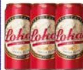
LOKAL LATÃO 473ml