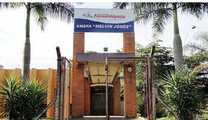
'Melvin Jones' apresenta o diferencial agrícola em tempo integral com ampla grade de atividades, unidade escolar atende crianças em ensino integral

A EMEFA (Escola Municipal de Ensino Fundamental Agrícola) 'Melvin Jones' de Fernandópolis oferece vagas para novos alunos se ingressarem na unidade neste ano de 2020. Além das disciplinas comuns do ensino regular, a escola apresenta o diferencial de uma escola agrícola e de tempo integral, para alunos do 6º ao 9º ano do ensino fundamental, com atividades direcionadas à área agrícola e cultural, com transporte gratuito.