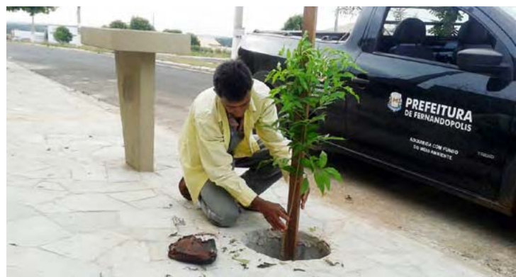
Município já ganhou mais de mil árvores pelo programa nos últimos três anos

O programa tem como finalidade aumentar a arborização e a diversidade de espécies na área urbana e promover um trabalho de educação ambiental referente à arborização urbana. No ano de 2017 o programa plantou 301 mudas em Fernandópolis e 354 no ano de 2018.