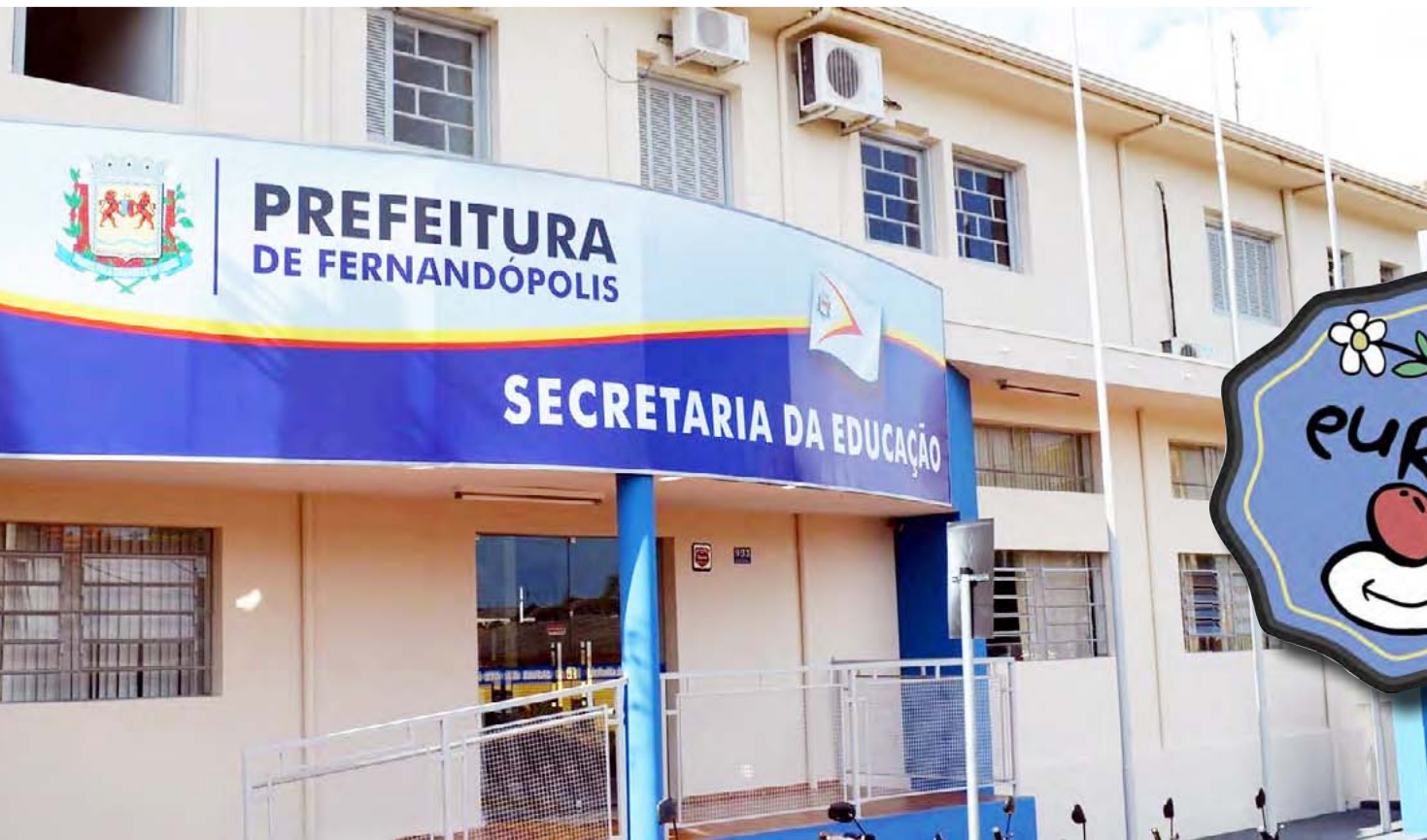
A coleta dos documentos será feita no auditório da Secretaria Municipal de Educação, das 09h às 16h

SOMENTE AS PESSOAS QUE AINDA NÃO CONCLUÍRAM O PROCESSO DE DOCUMENTAÇÃO DEVERÃO PARTICIPAR