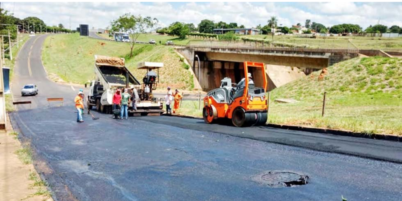
A Marginal Litério Grecco só será mão no sentido Brasilândia - Ubirajara

A Prefeitura de Fernandópolis vai promover nos próximos dias uma das principais e mais aguardadas alterações no trânsito local. Trechos das avenidas marginais Litério Grecco e Luiz Brambatti passarão a ter sentido