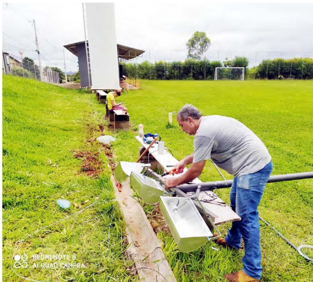
Projeto atende cerca de 160 crianças com treinos de futebol

No local há aulas de futebol para seis categorias: Sub 7; Sub 9; Sub 11; Sub 13; Sub 15; e Sub 17. As turmas começam a treinar cedo e há times que jogam até 22h. “Ter uma boa iluminação é importante porque temos aulas até a noite e podemos ficar no campo com mais segurança e melhor visibilidade. Por isso, somos muito gratos à Engerb e aos outros parceiros que nos ajudaram”, explicou Rubão.