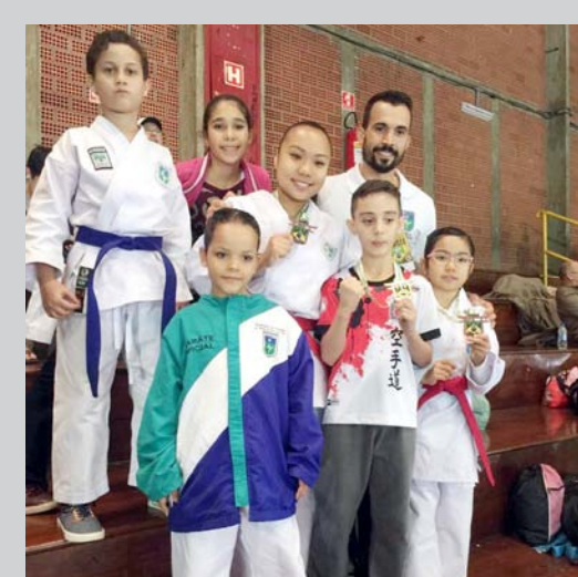
Os atletas jalesenses que também fazem parte da Seleção Estadual de Karatê, participaram do Campeonato Brasileiro realizado em São Paulo