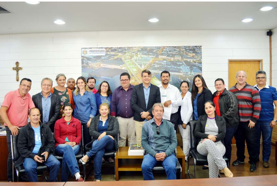
Representantes de entidades estiveram no gabinete para receber o pagamento referente à campanha

Na manhã desta quarta-feira, 17, o Conselho Municipal de Direitos da Criança e do Adolescente (CMDCA) de Fernandópolis, com o apoio da Prefeitura, por meio da Secretaria Municipal de Assistência Social e Cidadania, repassou para oito OSC (Organização da Sociedade Civil) locais, aproximadamente R$ 150 mil referentes à destinação dos recursos recebidos através das campanhas de arrecadação do Imposto de Renda e multas do Fórum.