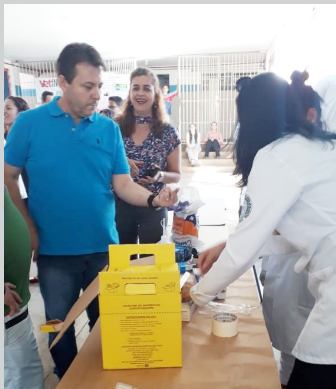
Alunos e professores de diversos cursos realizaram muitas atividades na Escola Estadual Carlos Barozzi