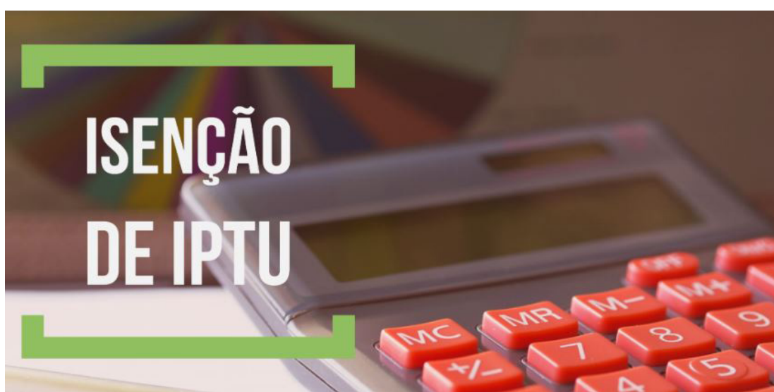
Regularização é obrigatória e deve ser feita no Poupatempo até o último dia útil de Setembro

O não comparecimento do cidadão aos balcões de atendimento da Prefeitura no Poupatempo até o último dia útil de setembro promoverá o cancelamento da isenção para o próximo ano, con-