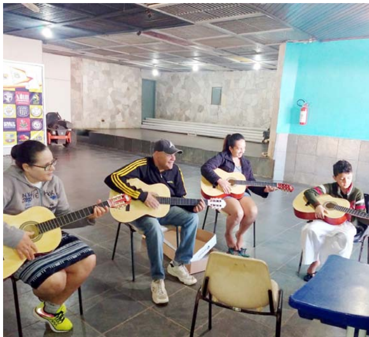
Atividades do PELC desenvolvidas nos polos de Fernandópolis

No dia 12 de agosto uma cerimônia de lançamento será realizada em Fernandópolis. A organização do evento será da Câmara Temática da Região Turística Maravilhas do Rio Grande. Fazem parte da região as cidades de Cardoso, Fernandópolis, Guarani d'Oeste, Indiaporã, Meridiano, Macedônia, Mira Estrela, Ouroeste, Paulo de Faria, Pedranópolis, Populina, Riolândia, Valentim Gentil e Votuporanga.