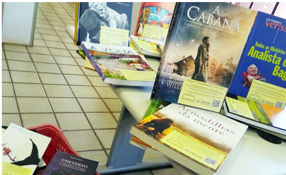
Iniciativa tem a intenção de disseminar a boa leitura pela troca de livros

A iniciativa faz parte do projeto "Trocando Histórias" e tem como intenção disseminar a boa leitura pela troca de exemplares, levando cultura, diversão, entretenimento e ampliação de novos conhecimentos aos cidadãos. Os livros, revistas, gibis, entre outros, ficam à disposição na recepção da Biblioteca Municipal e outros pontos públicos para possíveis trocas/leitura, ampliando assim, o universo informacional e cultural dos leitores. Através deste intercâmbio, o colecionador terá a possibilidade de adquirir novos exemplares (dos quais não dispunha) ampliando, assim, seu acervo particular. Para participar da iniciativa é simples, basta pegar qualquer um dos livros que estiver disponível, levar para casa para ler, depois, se quiser, pode trocá-lo por outro ou até mesmo fazer a doação de algum que faça parte de seu acervo pessoal.