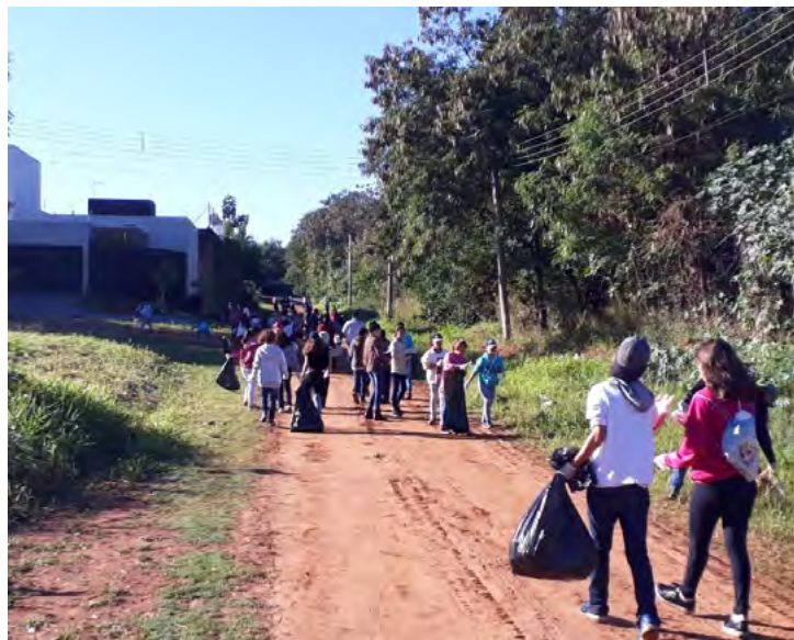
Nesta quarta-feira foi realizado o serviço de limpeza às margens do Ribeirão Santa Rita

A Prefeitura de Fernandópolis, por meio da Secretaria Municipal de Meio Ambiente, desenvolve uma agenda especial de ações para comemorar a Semana do Meio Ambiente, tendo como objetivo conscientizar a população com relação à preservação.