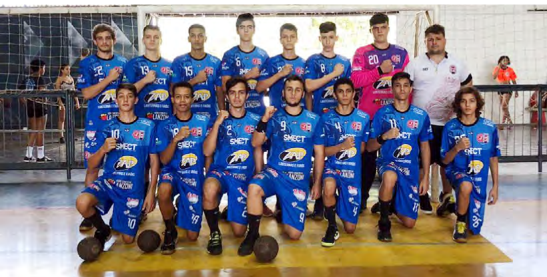
A categoria Infantil Masculino conquistou sua vitória sobre o time de Castílio

No último domingo aconteceu mais uma rodada da Liga Regional de Handebol do Estado de São Paulo (LRHESP) na cidade de Fernandópolis. Jales entrou em quadra em três categorias da Liga, a Infantil Masculino, Infantil Feminino e Sub20 Masculino.