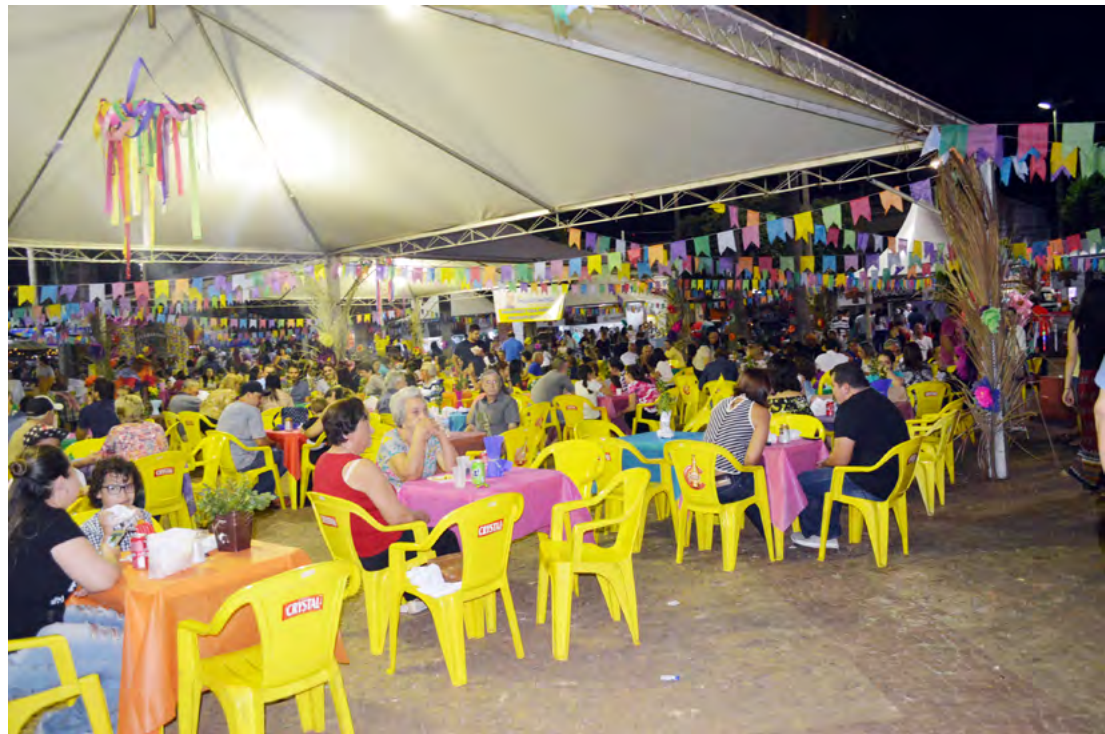
Uma grande festa é preparada para a edição 2019 do FernanRaiá nos dias 05 e 06 de julho

Em meio à solidariedade e resgatando as tradições caipiras, a Prefeitura de Fernandópolis mais uma vez se prepara para o 'FernanRaiá', que neste ano acontecerá nos dias 05 e 06 de julho. Na manhã desta terça-fei-