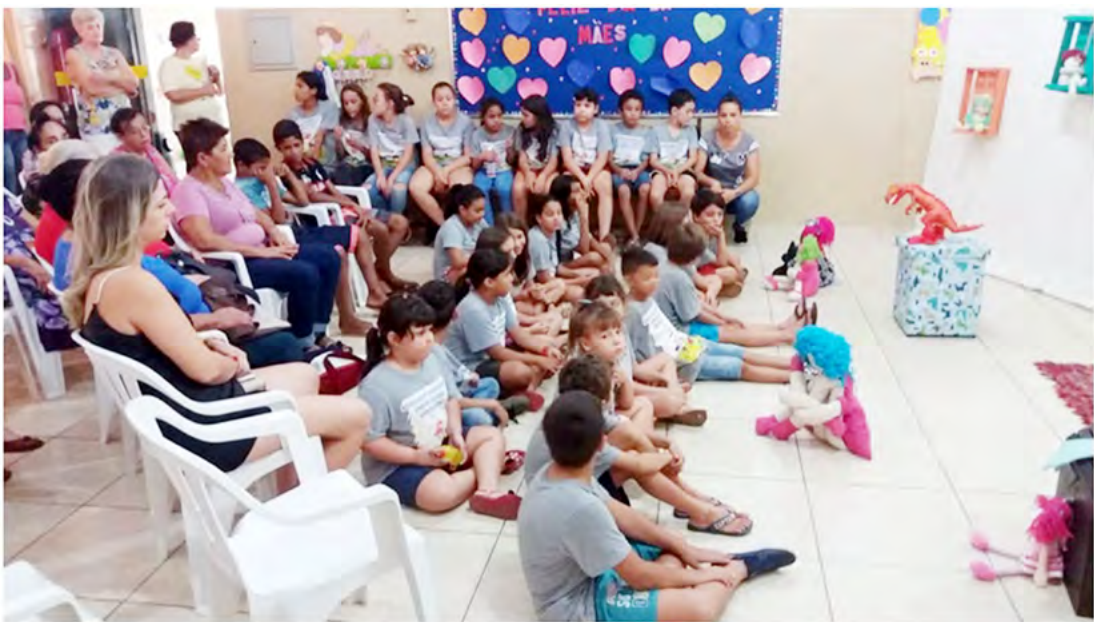
Neste ano, campanha levou ao público o espetáculo teatral "Meu Quarto, Minha Inocência"

Entre os dias 28 e 31 de maio, o CREAS e os quatro CRAS do município (Vida Nova, Recanto dos Oitis, Bem Viver e Nova Era), realizaram mais uma edição da 'Campanha contra o Abuso e Exploração Sexual de Crianças e Adolescentes' em Fernandópolis.