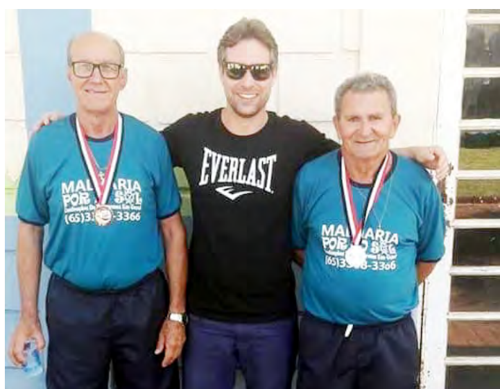
Atletas de Fernandópolis participantes do JORI. Esportistas da cidade disputaram em 15 modalidades