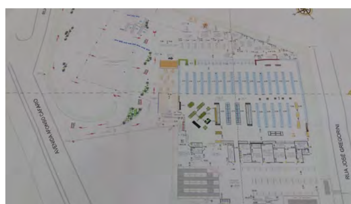
Prédio fica pronto dentro de seis a oito meses e deve gerar cerca de 140 empregos diretos