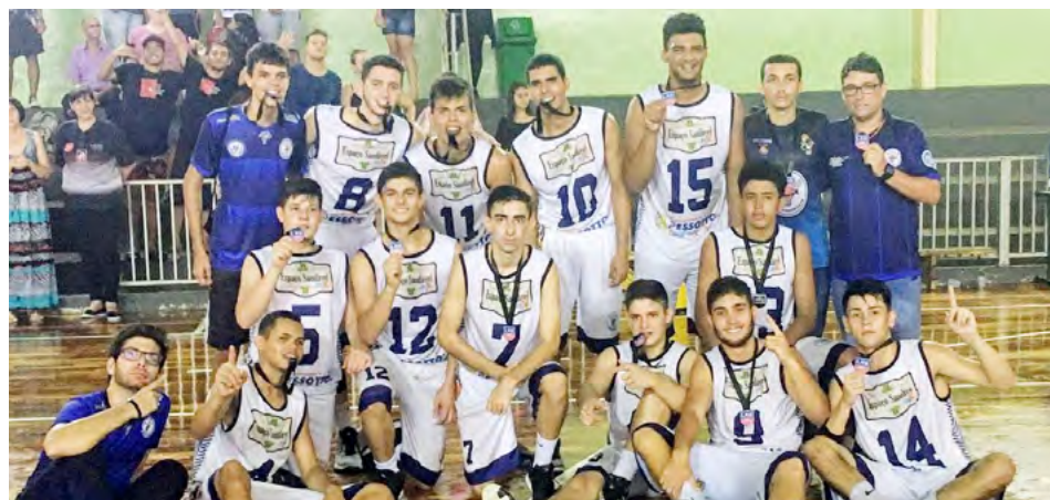
Equipe venceu por 81X56 a final realizada no domingo contra o Instituto Chui, de Franca