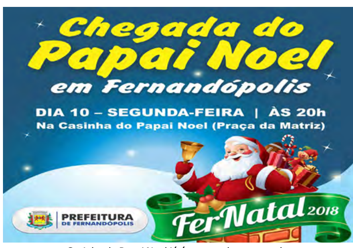
Casinha do Papai Noel já é preparada para receber o público a partir da próxima segunda-feira

A chegada do mês de Dezembro traz a cada ano o clima de festividade, a magia das cores e a renovação dos sonhos. Um dos momentos mais marcantes do clima de Natal, em especial para as crianças, é a visita do Papai Noel e Fernandópolis já vivencia esse clima. Na próxima segunda-feira, dia 10, a partir das 20h, o "Bom Velhinho" chega à cidade para ficar até o próximo dia 21 na sua casinha, localizada na praça central. Depois de percorrer as principais ruas em uma carreata que começa às 19h30, a caravana do Papai Noel se dirige à praça central onde será realizada a tradicional entrega das chaves. A casinha, que já está sendo decorada especialmente pela equipe da Secretaria Municipal de Educação, ficará à disposição