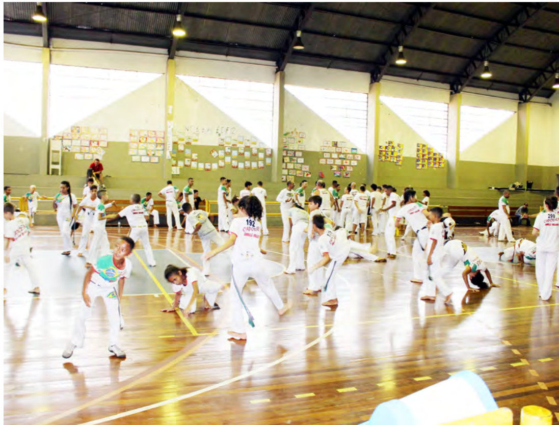
O campeonato chegou a sua 19ª edição neste ano, com um número maior de participantes, reunindo aproximadamente 150 atletas