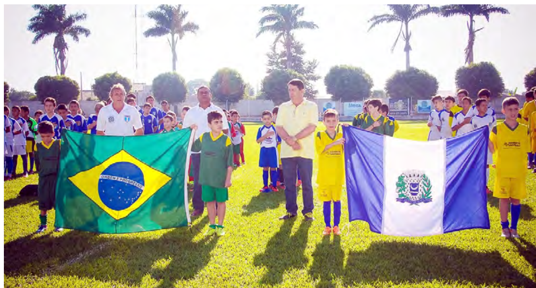
Mais de 370 crianças participam da escolinha de futebol e os três primeiros colocados de cada categoria serão premiados

Ainda segundo Adilson Segura “este momento é também especial para os pais e familiares, e se torna um momento de lazer para a nossa população”.