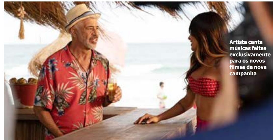
Artista canta músicas feitas exclusivamente para os novos filmes da nova campanha