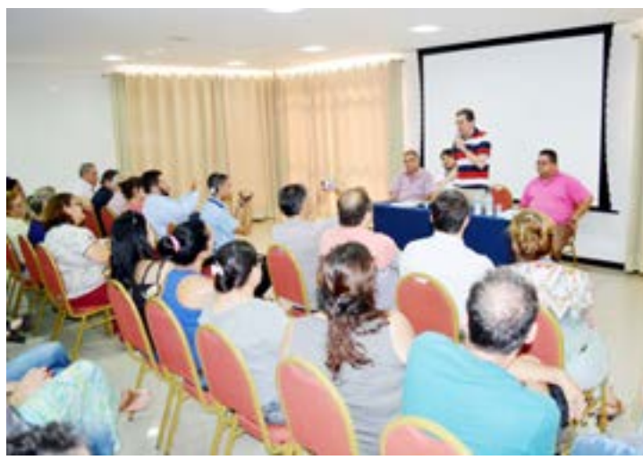
Com articulação do deputado federal Fausto Pinato, recurso aumenta de R$ 920.442,72/ano para R$ 1.354.146,16

Uma importante conquista para a área da saúde de Fernandópolis foi anunciada em entrevista coletiva na tarde desta sexta-feira, 26, pelos gestores da Prefeitura e o deputado federal Fausto Pinato. Com articulação de Fausto, os recursos do MAC (Média e Alta Complexidade) passam de R$ 920.442,72/ano para R$ 1.354.146,16/ano, um aumento de 47%, o que vai possibilitar a melhoria nos serviços existentes e aumentar atendimentos de Oftalmologia, reduzindo a fila que atualmente está com demora de quase dois anos.