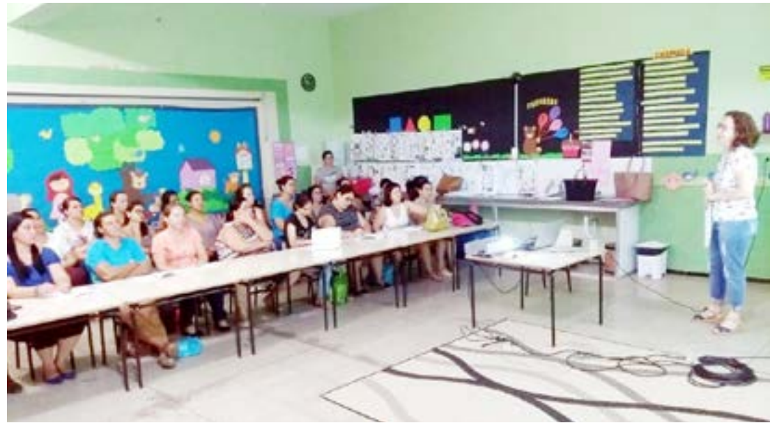
O tema Autismo foi abordado na EMEI “Professora Gema Prandi Rosa”