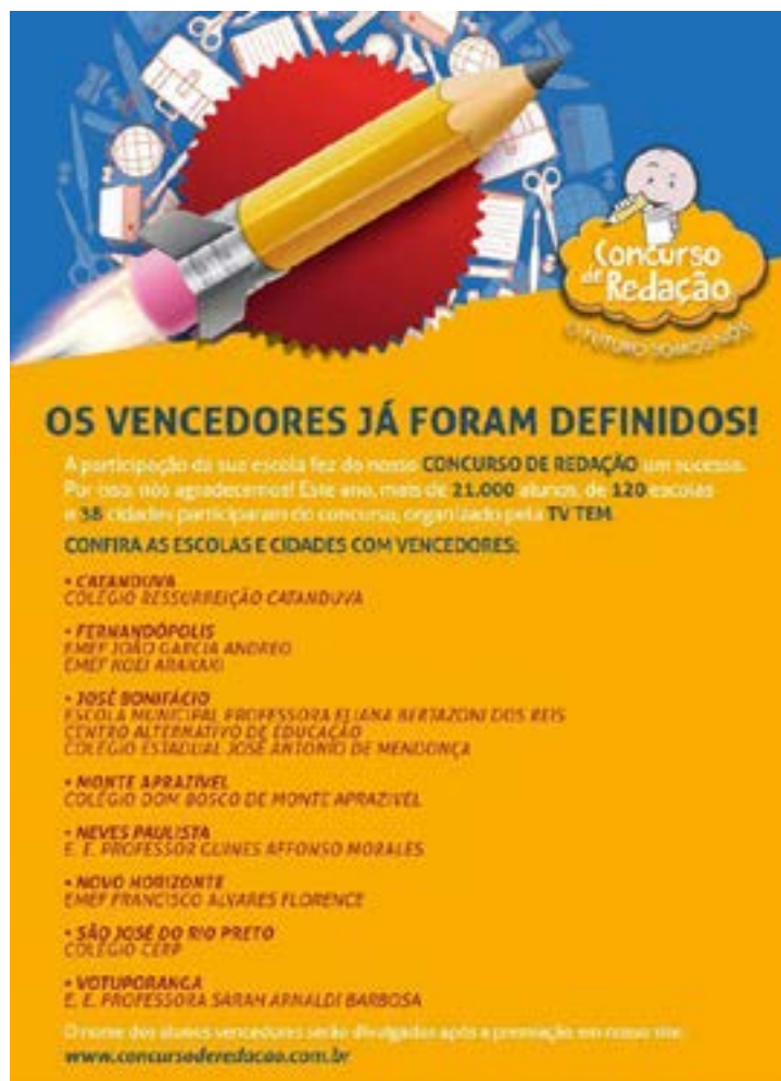
Alunos serão premiados na próxima semana, em cerimônia na cidade de São Jose do Rio Preto

O concurso sempre aborda temas atuais e conta com o apoio das Diretorias Regionais e Secretarias Municipais de Educação.