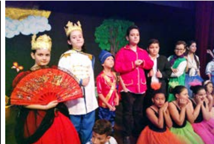
Espectáculos tiveram início no dia 01 de outubro e seguem até hoje. Como encerramento, subirão ao palco atores que se apresentaram em edições anteriores do evento