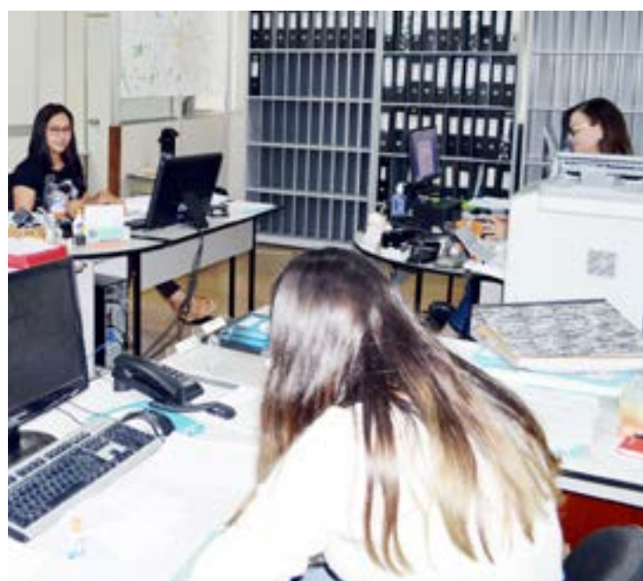
Servidoras da Secretaria Municipal de Gestão