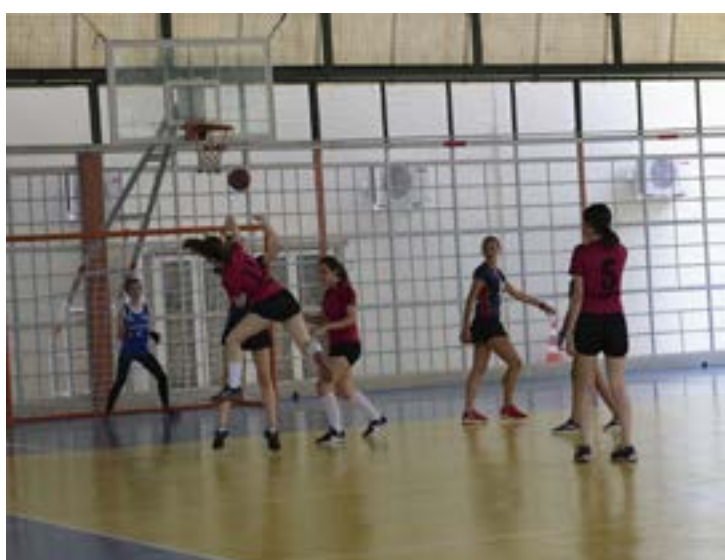
Competição, realizada na quadra do Campus Centro, reuniu seis times de escolas públicas e particulares de Votuporanga

A equipe de Handebol feminino do Colégio Unifev se consagrou, sexta-feira (dia 19), como bicampeã do Campeonato Aberto da modalidade. O time vencedor é formado por alunas das três séries do Ensino Médio. A 2ª edição da competição reuniu os times das escolas Anglo, Celtas, Dinâmica, Dom Bosco e Instituto Federal de São Paulo (IFSP), na quadra do Campus Centro.