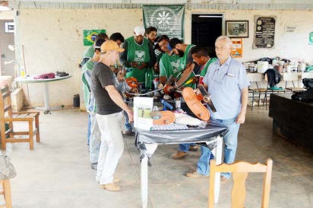
Parceria da Prefeitura com SENAR e Sindicato Rural proporcionou cursos para uso de Roçadeira Lateral e Manutenção em Jardim

A Prefeitura de Fernandópolis reuniu 32 profissionais da Frente de Trabalho para capacitações com a equipe técnica do Senar (Serviço Nacional de Aprendizagem Rural), em parceria com o Sindicato Rural, com o objetivo de aprimorar a mão de obra dessas pessoas que atuam nas secretarias municipais de Meio Ambiente, Agricultura e no Almozarifado.