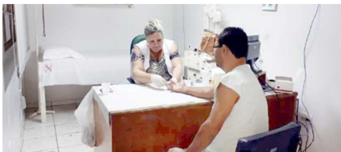
Palestra: “A situação atual da sífilis” será ministrada no dia 30 de outubro

As ações realizadas pelo Cadip tentam aumentar a conscientização da população para uma doença de fácil identificação e tratamento, mas que continua produzindo muitas vítimas, principalmente entre recém-nascidos.