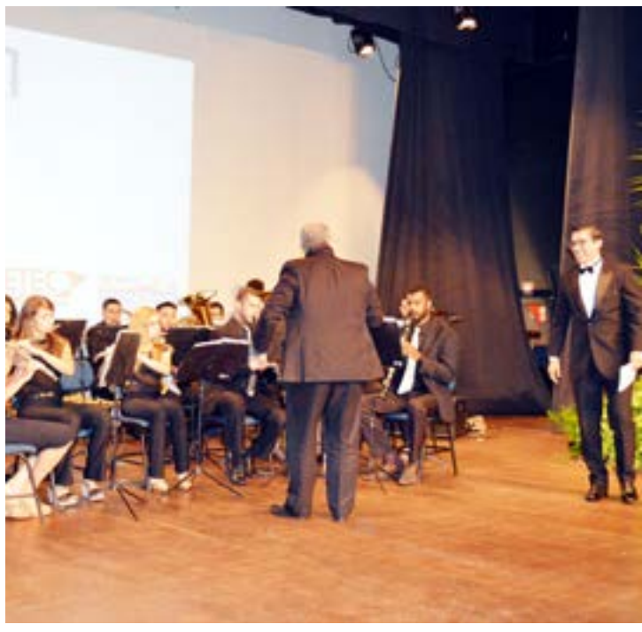
Projeto em parceria com a Prefeitura de Fernandópolis premiará os vídeos mais criativos