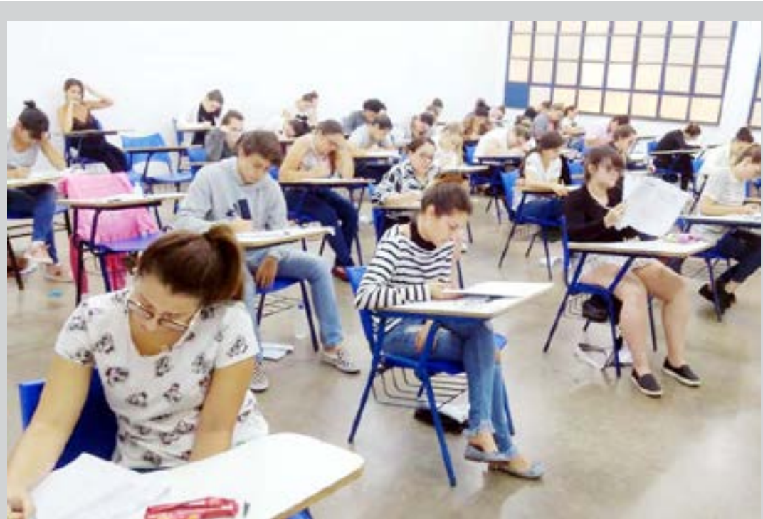
As provas, realizadas na sexta-feira, 19 e foram realizadas em três cidades. Candidatos disputam 205 vagas em Fernandópolis

melhorias no serviço e cuidados com o meio ambiente durante a manutenção de jardins. A parceria entre Prefeitura, Sindicato Rural e SENAR visa à beneficiar os trabalhadores, capacitando-os não apenas para o período em que estão no programa Frente de Trabalho, mas para que tenham condições de continuar atuando nestas áreas profissionais depois que saíram da Prefeitura.