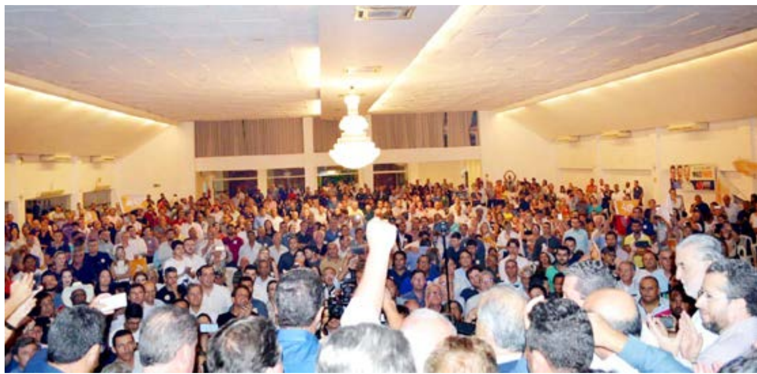
Evento reuniu 116 prefeitos da região em apoio à Márcio França

Além de anunciar apoio a Márcio França, Pinato reiterou apoio ao candidato à presidência, Jair Bolsonaro. “Será uma dupla renovação. Lá em Brasília e aqui em São Paulo”, avaliou.