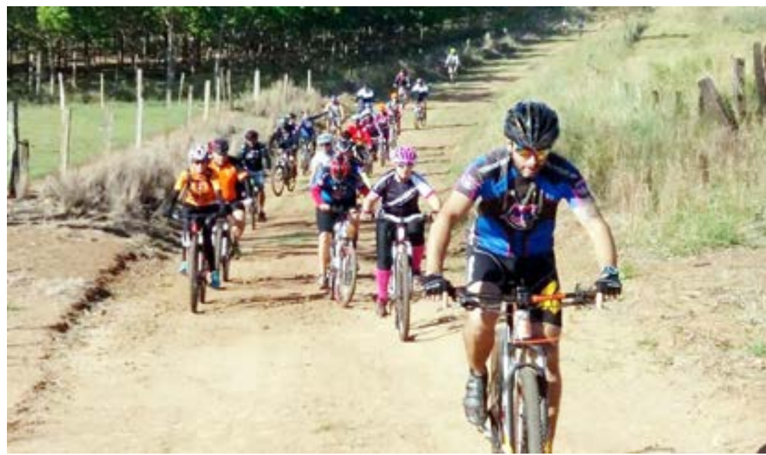
“3º MK Race” e pedal acontecerão no dia 11 de novembro

O 3º MK Race Mountain Bike proporcionará ao atleta inscrito e participante uma aventura pelas estradas e trilhas de terra da região.