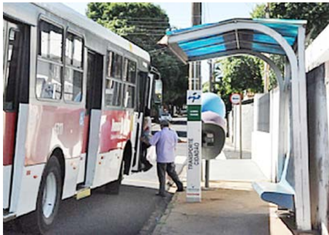
Projeto conta com tomadas para carregar equipamentos eletrônicos; meta é cobrir todos os pontos da cidade

Os cinco primeiros que receberão cobertura estão na Avenida Emílio Arroyo Fernandes, entre a Avenida Nasser Marão e Avenida Jerônimo Figueira da Costa (Calçada Fachinni); na mesma Avenida, do lado oposto a este ponto (Calçada Galego); Rua Dante Furlani (Praça Colinas);