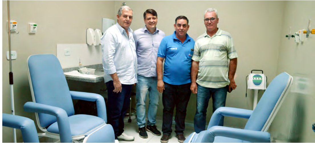
Prefeito, vereadores, profissionais da Saúde e servidores municipais em visita à UPA

“Há um ano eu estive aqui para uma visita não muito agradável, quando a situação financeira estava muito difícil e pensamos em fechar a UPA. Essa nossa atitude chegou ao conhecimento do Ministério da Saúde, quando conseguimos ser ouvidos e conquistamos alguns aparelhos, camas e, principalmente, a qualificação da UPA. Agora, um ano depois, venho aqui para comemorar os dois anos da UPA e agradecer aos profissionais pelos trabalhos realizados aqui; também anunciamos hoje o lançamento de uma campanha de divulgação