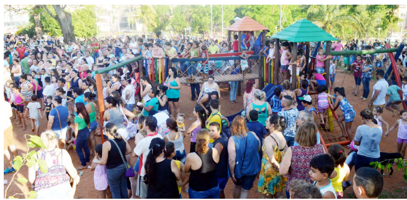
Alegria, cores, muita diversão e distribuição de doces e sorvetes estão garantidos veja a foto da edição 2017 do evento

Com entrada gratuita, a 'FernanKids' será realizada até às 20h.