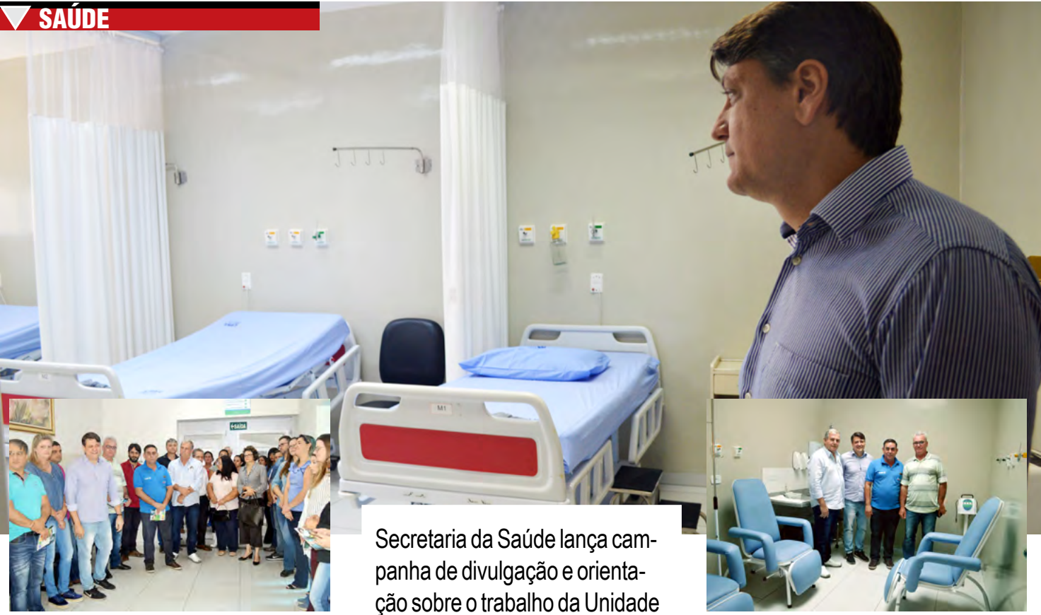
Secretaria da Saúde lança campanha de divulgação e orientação sobre o trabalho da Unidade