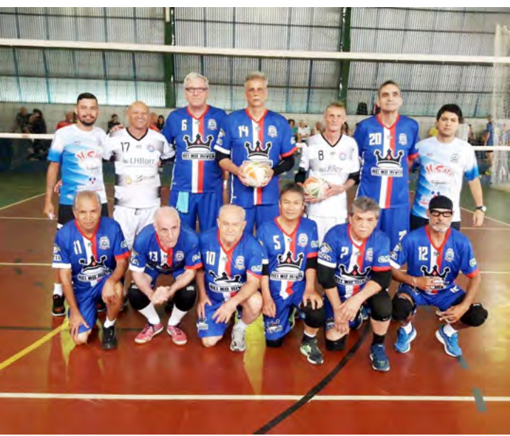
A equipe jalesense masculina de voleibol adaptado conquistou o primeiro lugar na categoria 60+, acima de 60 anos masculino

Delegação foi até Água de São Pedro, no interior de São Paulo, para disputar o Campeonato de Minobol